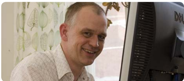
Capee Groups utvecklare ligger steget före

Funktionen är enkel att använda och extremt snabb; vi talar om sekunder. Då operatören finner en driftavvikelse och markerar denna i sin trendkurva, ges direkt svaren på vilka, bland hundratals mätvärden, de orsakande faktorerna kan vara. Resultatet presenteras som pilar i styrsystembilderna, samtidigt som tänkbara faktorer rangordnas i sannolikhetsordning.