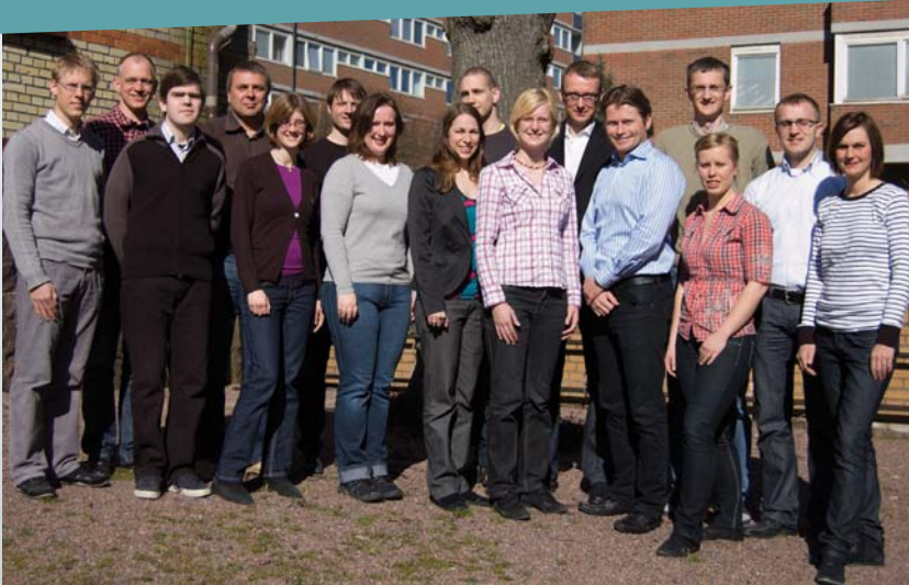
Pulp and Paper Power gläds åt nätverkets framgångar

NEWS NEWS NEWS NEWS NEWS NEWS NEWS NEWS NEWS NEWS NEWS NEWS NEWS NEWS