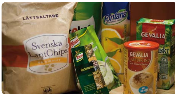
Förpackningar där Xylophanes barriär skulle kunna användas

Intresset är stort och förväntningarna höga på hur Xylophane kan utveckla och förnya förpackningsindustrins traditionella material. Från att tillsammans med förpackningstillverkaren Jonsac ha påvisat funktionen som fettbarriär i industrisäckar för kryddor, går man nu vidare och anpassar materialet för nya användningsområden. Också detta utvecklingsarbete sker i nära samarbete med kunderna.